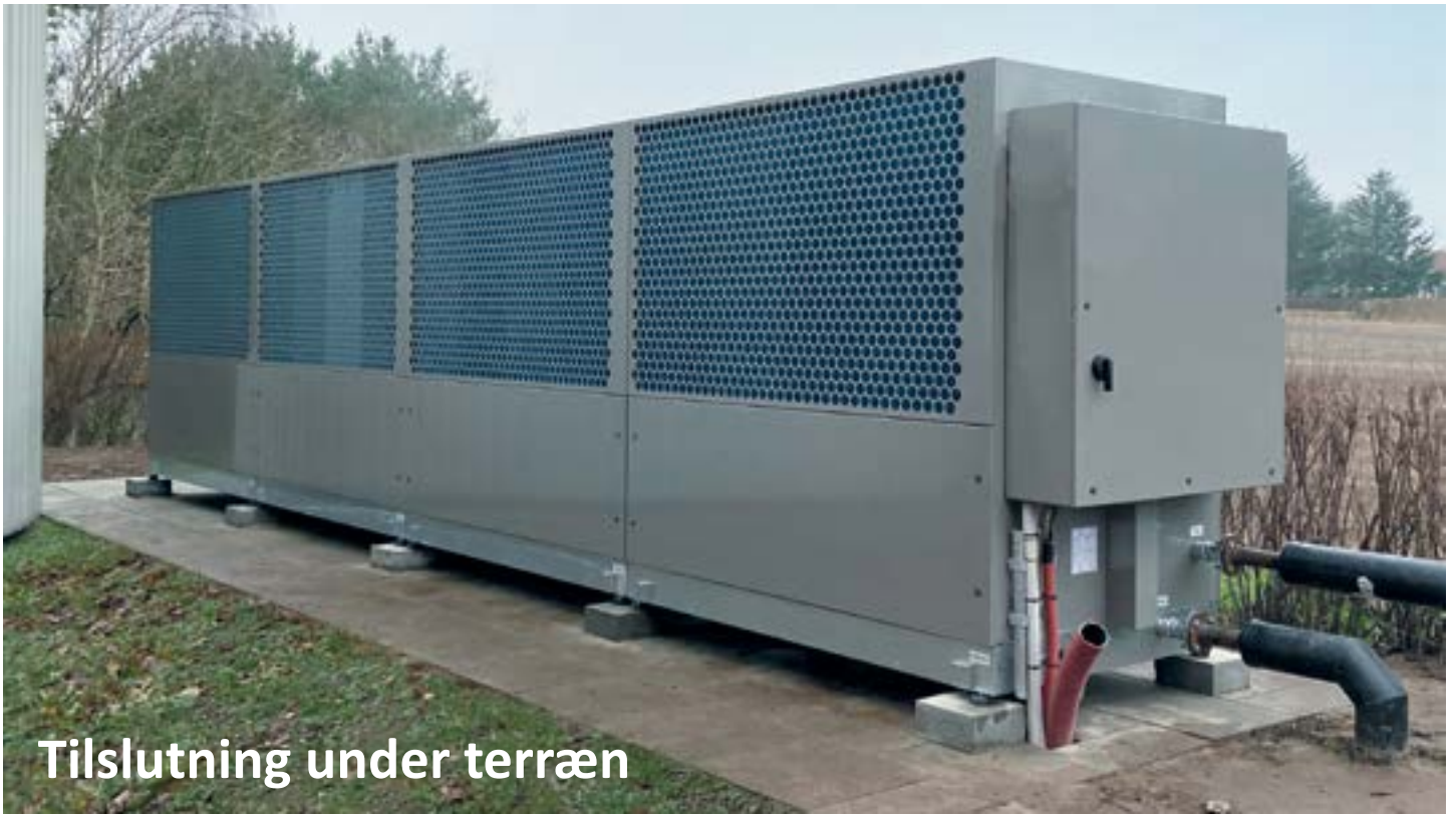
Tilslutning under terræn