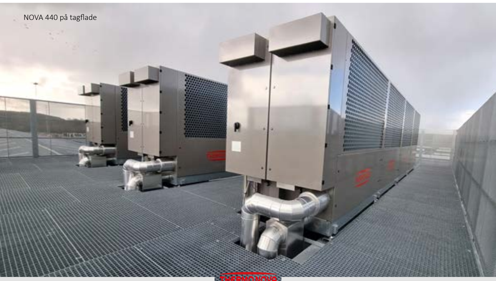
NOVA 440 på tagflade

Underkøleren sikrer samtidig en tilstrækkelig overhedning af kompressorens sugegasledning, således at kemisk forbindelse mellem kølemiddel og smøreolie ikke opstår.