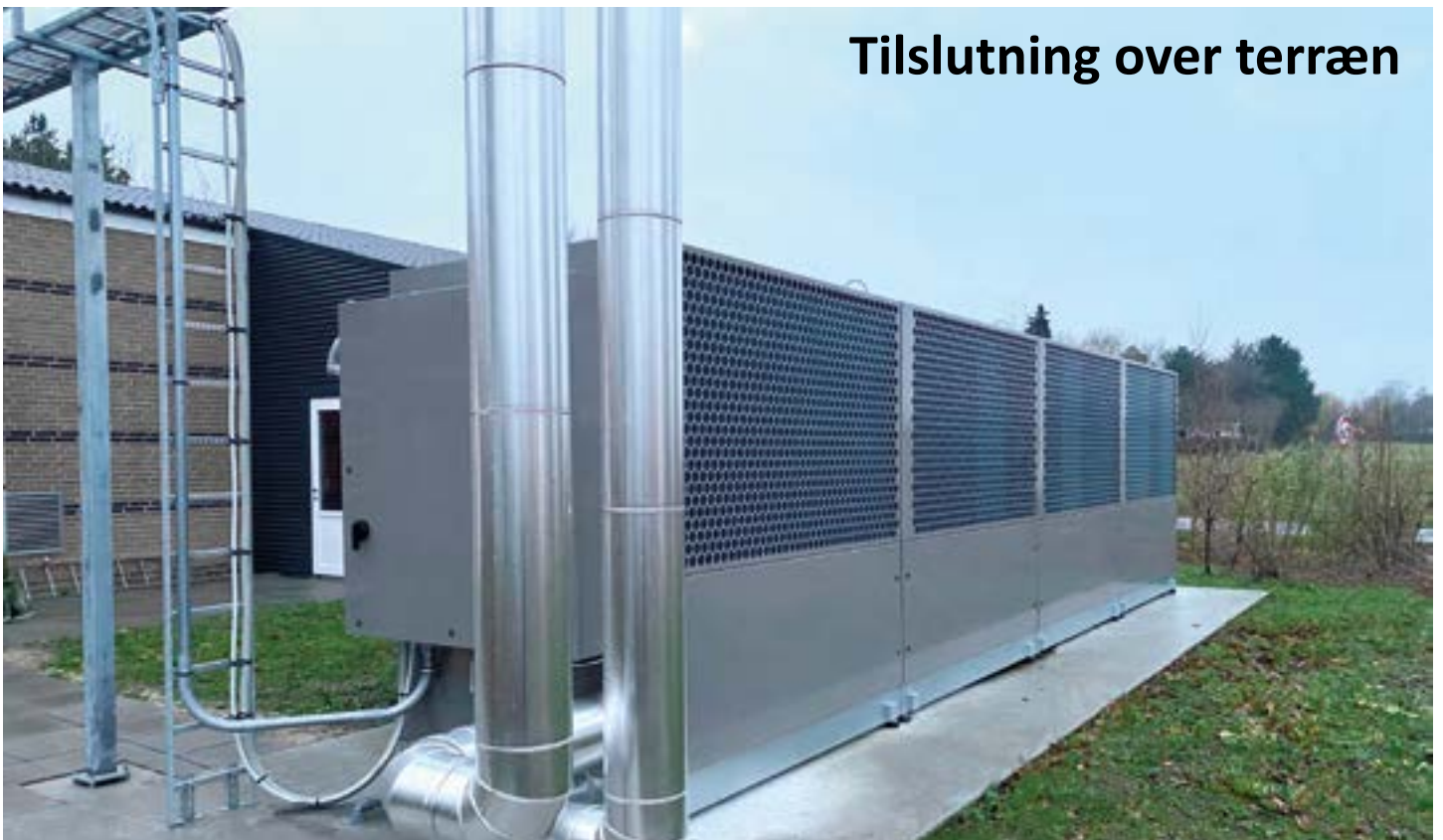
Tilslutning over terræn